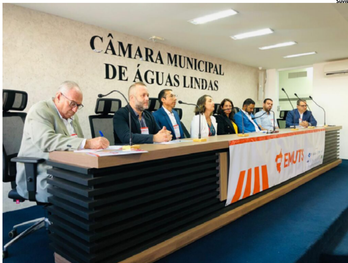
Evento discutiu como problemas na Mobilidade afetam sistema de saúde.

O encontro, promovido pela SES-GO em parceria com a Secretaria Geral de Governo, as Universidades Federal