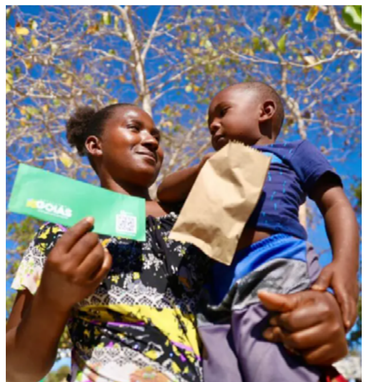
Mãe em Cavalcante, recebendo o seu benefício do Mães de Goiás

Lançado em agosto de 2021, na sua primeira etapa o programa contratou 6.250 jovens vulneráveis, de 14 e 15 anos e 11 meses, para trabalhar em órgãos públicos estaduais. Em setembro de 2023 deu início à contratação de mais 10 mil. Eles recebem R$ 663,39 de salário, R$ 150 de vale-alimentação, vale-transporte, seguro de vida, uniforme, crachá, férias, 13º salário e cursos de capacitação na plataforma do programa. Já foram R$ 164,4 milhões investidos.