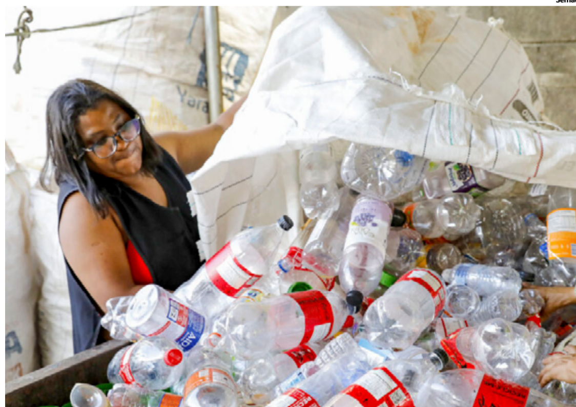
Estes dados estão no relatório de monitoramento do Plano Estadual de Resíduos Sólidos (PERS), que começou a ser produzido no segundo semestre do ano passado

Esses dados estão no relatório de monitoramento do Plano Estadual de Resíduos Sólidos (PERS), que começou a ser produzido no segundo semestre do ano passado. O PERS é um documento que delinea as metas, diretrizes e objetivos previstos para a gestão de resíduos sólidos no estado de Goiás. Ele norteia o trabalho da