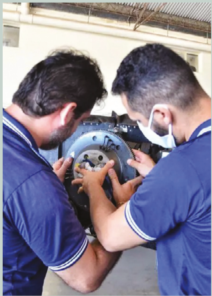
Números atualizados, que foram divulgados pelo Ministério do Trabalho e Emprego (MTE), mostram que o principal destaque é o setor de serviços