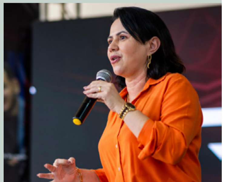
A situação tornou-se ainda mais complicada após as legendas PMB e Agir36 optarem por apoiar outros pré-candidatos