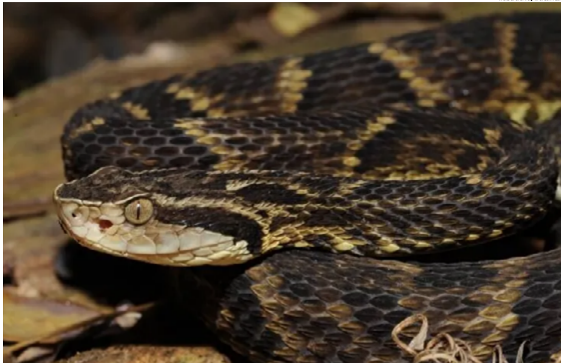
O efeito do veneno da jararaca muda conforme a idade do réptil

Ao chegarem ao local, os bombeiros utilizaram pinçotes adequados para capturar a serpente, garantindo a segurança