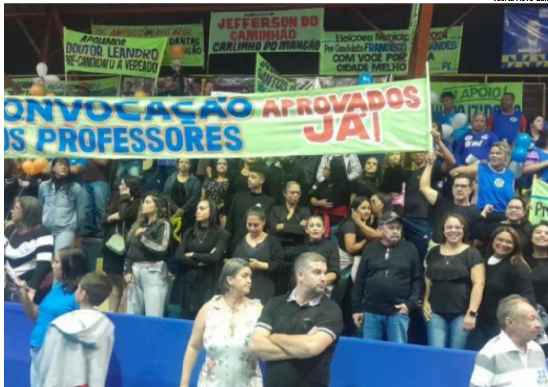
Os manifestantes participaram do evento com o intuito de chamar a atenção das autoridades municipais e do público presente para a situação que enfrentam.

De acordo com os manifestantes, a solicitação para que saíssem foi acompanhada da promessa de que representantes do grupo seriam recebidos nesta terça-feira (06) pelo procurador e pelo advogado do município. Após deixarem o recinto, os aprovados permaneceram do lado de fora,