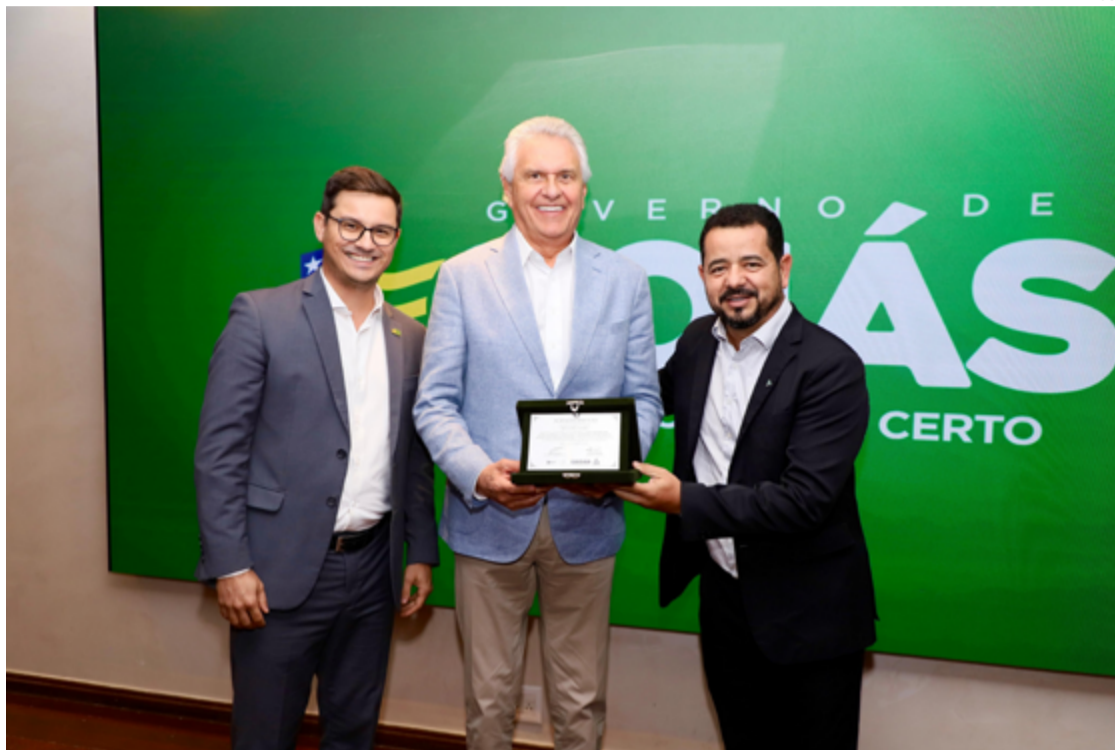
A assembleia reúne os dirigentes das instituições públicas de 26 estados brasileiros e do Distrito Federal para debater assuntos relevantes para o fortalecimento das entidades em todo o país.

“O governador Ronaldo Caiado se empenha todos os dias para fazer com que a Ema-